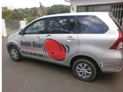
Huidige Toyota Avanza

van het werk in gevaar komt. Operation Bobbi Bear wil opnieuw een Toyota Avanza en heeft inmiddels een offerte van een lokaal autobedrijf hiervoor.